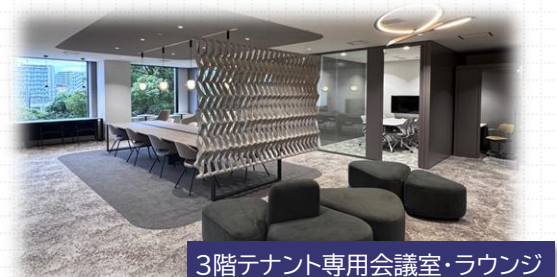
3階テナント専用会議室・ラウンジ