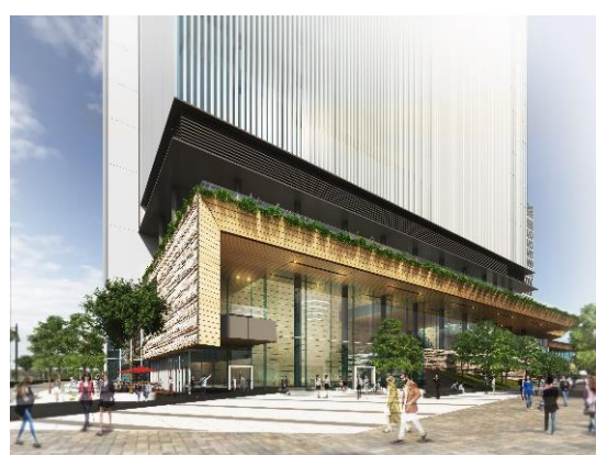
みなとみらい21 中央地区53街区 完成イメージ