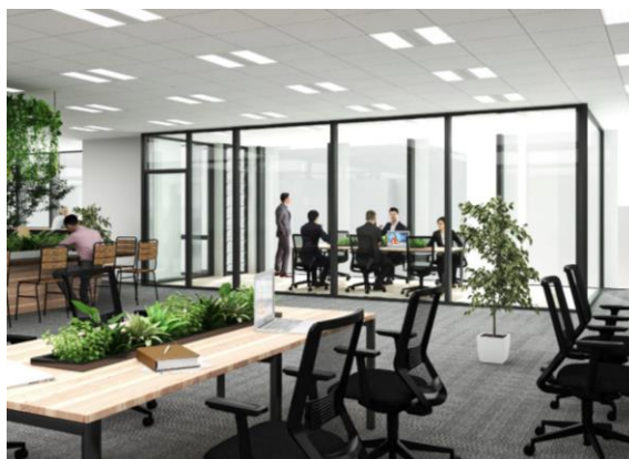
自然の風を窓から取り込める会議室イメージ (イーストタワー)

加えてイーストタワーのオフィスでは、外気の温湿度などを計測して自動開閉するジャロジー窓により、自然の風が窓から取り込める会議スペースやリフレッシュスペースを設置することが可能な計画としています。