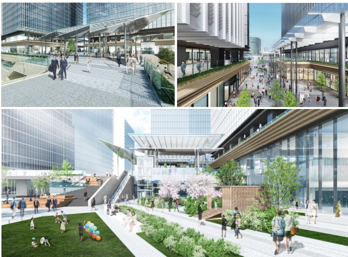
コモンスペースイメージ（上段：2階グランモールプラザ・スカイプラザ、下段：1階ゲートプラザ）

低層部にはヤマハブランドの発信拠点や、飲食・物販などの店舗、オープンイノベーションスペースといったアクティビティフロアを整備します。各コモンスペースは、各種イベントや屋外ワークスペースなどの利用を想定しており、にぎわいの創出に貢献するとともに、オフィスワーカーや来街者にとっての憩いの環境や交流の場を提供します。多様な働き方やさまざまな企業活動に対応することで、企業集積が目覚ましいみなとみらい21中央地区全体の活発なオープンイノベーションを促進します。