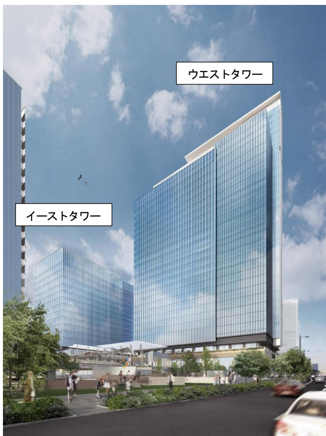
「横浜シンフォステージ」ロゴマークおよび外観イメージ